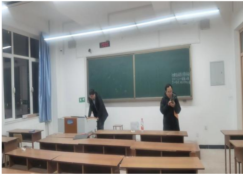
教室设备改造现场

从细节做起，聚焦师生上课体验。为给各位老师提供良好的授课环境，教室管理科持续推进教学设备升级改造，全体人员自开学前两周以来，对从旧校区迁入新校区的 38 套设备中的电脑统一进行升级维护改造。